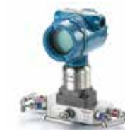
Интеллектуальные средства измерения Rosemount

Широкая линейка приборов для измерения абсолютного давления, температуры, расхода на основе перепада давления. Поставка ультразвуковых, термодифференциальных, а также расходомеров работающих на других принципах от ведущих производителей.