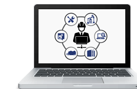
Программное обеспечение OpenEnterprise

Широкая линейка приборов для измерения абсолютного давления, температуры, расхода на основе перепада давления. Поставка ультразвуковых, термодифференциальных, а также расходомеров работающих на других принципах от ведущих производителей.