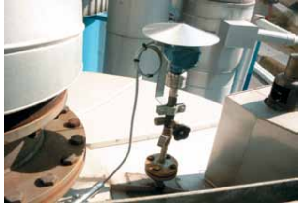
Рис. 3 Сенсор ERS низкого давления, установленный наверху резервуара

Существуют технологические процессы, где необходимо точно отслеживать и контролировать давление газовой подушки в резервуаре. Система ERS позволяет получать данную информацию двумя способами: с помощью хост-системы с поддержкой HART, используя сигналы 4...20 мА с конвертером сигнала TriLoop; и посредством беспроводной связи с применением THUM-преобразователем HART-сигнала.