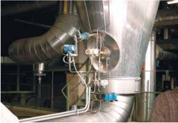
Рис. 2 Сенсор ERS высокого давления, установленный внизу резервуара