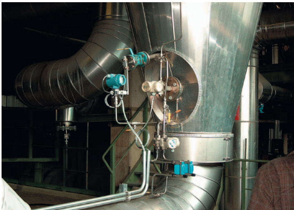
Рис. 2. Сенсор ERS высокого давления, установленный внизу резервуара

Дополнительную информацию о системе вы можете получить из раздела www.metran.ru/ERS , а также из обучающих семинаров, проходящих в рамках школы автоматизации на базе ПГ «Метран». ✉