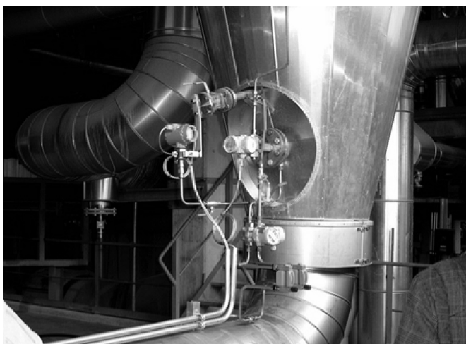
Рис. 2. Сенсор ERS высокого давления, установленный внизу резервуара