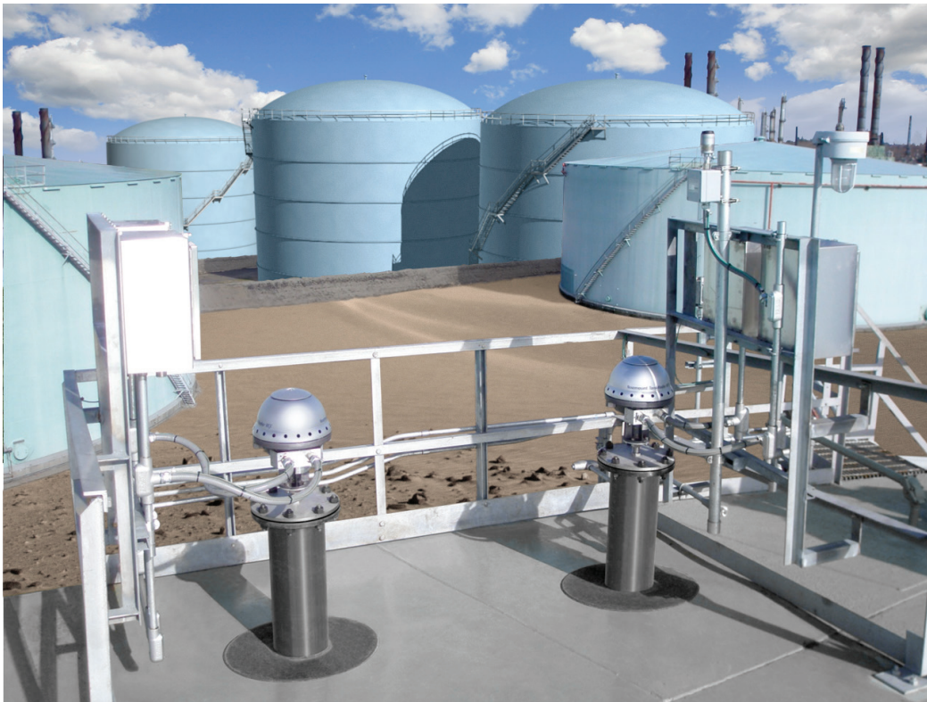
2xATG pour le contrôle de niveau et la prévention des débordements Une perspective qui se généralise lors du remplacement d'anciens contacteurs de niveau par des solutions modernes.

L'API 2350 s'est inspirée de la démarche temporelle de la norme CEI 61511. De la spécification des exigences à la mise en service, aux opérations et à la mise hors service, l'ensemble du