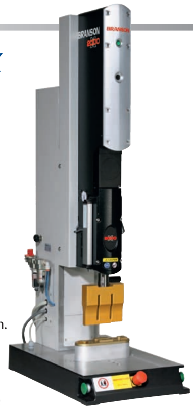
Ensemble de soudage série 2000X, modèle aef

Vanne proportionnelle réglable: permet des vitesses de descente différentes de la glissière ainsi qu'un profilage de la force avec des modifications de l'ordre de la milliseconde