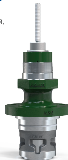
Патрон трима Fisher easy-e

Включив патрон трима в свой перечень запасных частей, вы получите возможность значительно повысить готовность вашего регулирующего клапана к техническому обслуживанию. Вы сможете более точно планировать время и ресурсы, необходимые для ремонта, свести к минимуму запасы запасных частей и выполнять ремонт в соответствии с графиком. Патрон трима easy-e должен дать вам полную уверенность в том, что вы будете готовы к любому следующему запросу на выполнение технического обслуживания.