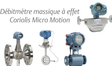
Débitmètre à effet vortex Rosemount™ 8800, débitmètre à pression différentielle 3051SFC et débitmètre électromagnétique 8732