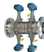
Rosemount 8880 Quad Débitmètre à effet vortex

Voici certains produits d'Emerson certifiés de sécurité selon la norme CEI 61508