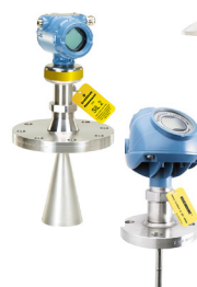
Rosemount 5408 et 5300 Radar sans contact et radar à ondes guidées