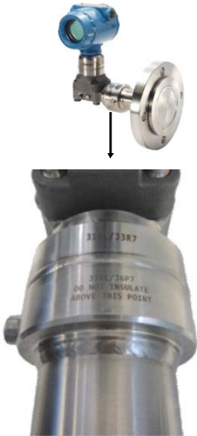
Figur 2. Isolasjonshensyn angående ekspansjonstetningssystem for et termisk område

Ekspansjonstetningssystemet for et termisk område bruker varme fra prosessen for at begge væskene i systemet skal fungere på riktig vis, og isolasjon er derfor ikke alltid nødvendig. Det er imidlertid alltid best å isolere systemene, slik at de kan holdes i optimal drift. Ekspansjonsenheten for det termiske området skal aldri isoleres over linjen som er merket på selve tetningen. Se figuren nedenfor som referanse.