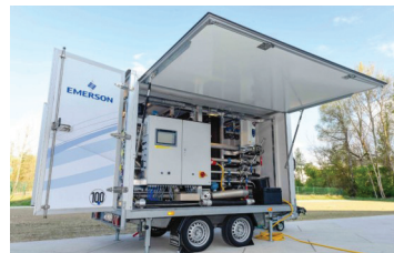
Vor-Ort-Kalibrierung über eine anhängermontierte Mobilstation