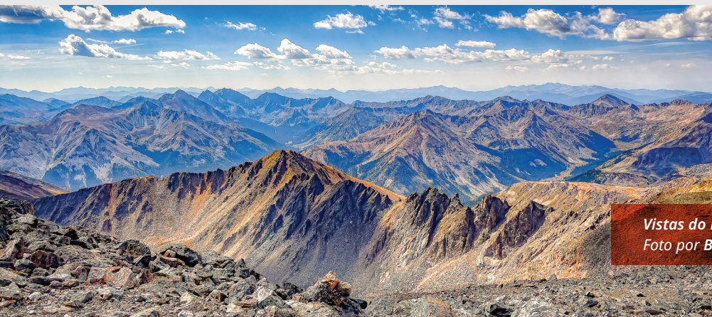
Vistas do Pico Grays, Colorado