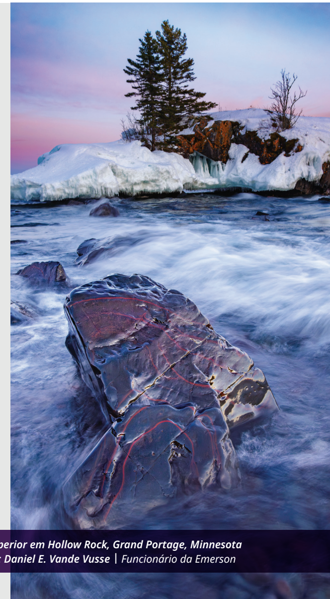
Lago Superior em Hollow Rock, Grand Portage, Minnesota

A tecnologia Ovation™ da Emerson recebeu cobertura da certificação da Lei de Segurança em fevereiro de 2023.